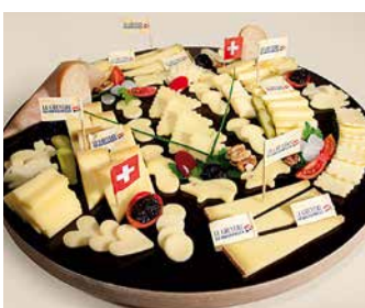
Plateau de Gruyère